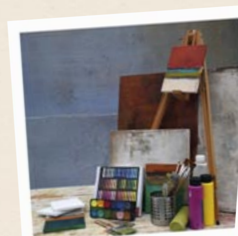
Für die Kreativtherapie: Farben, Pinsel, Leinwand ...