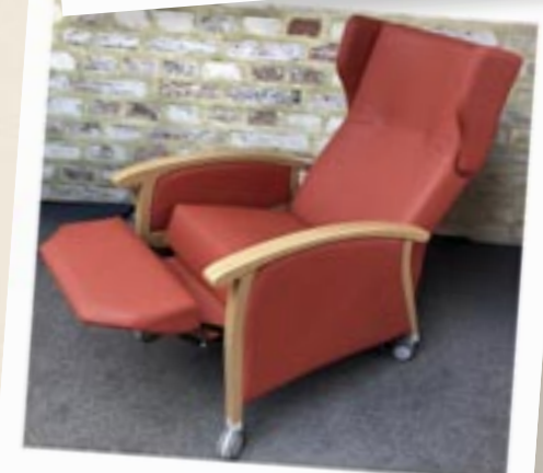
Ruhe- und Relaxsessel