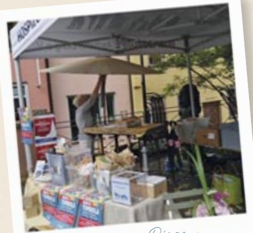
Lauter feine Dinge - liebervoll von Hand gemacht