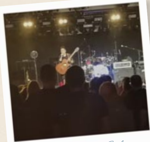
Party im Colos-Saal