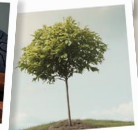
Fürs „Grüne“: Bäume für den Außenbereich