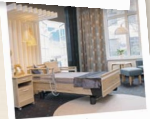
Einrichtung für ein Patientenzimmer