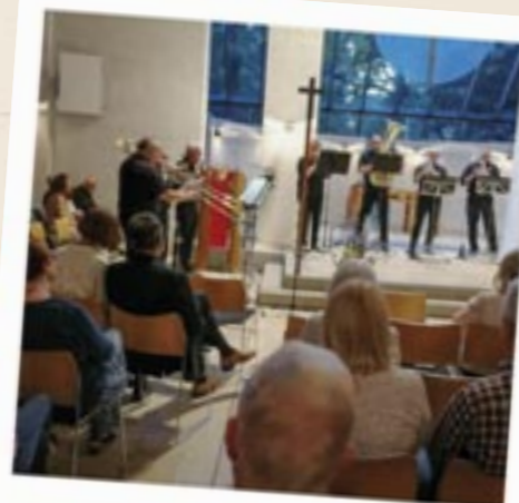
Blasmusik in der Christuskirche