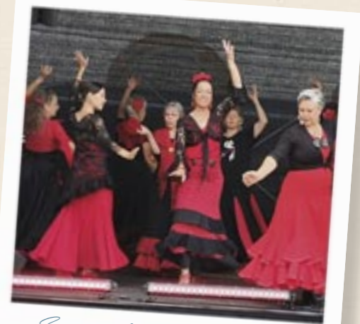
Sommerfestival am Karlsplatz in Aschaffenburg