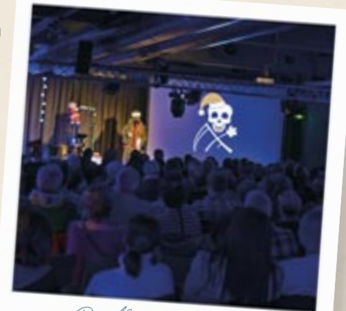
Death Comedy in der Herbert-Neumeier-Lounge

„Gutes tun stirbt halt einfach nicht aus, dafür Sorge ich persönlich“, sagt Der Tod . Im Rahmen seiner Tournee machte er Ende November Halt in Aschaffenburg. Frech, respektlos und makaber präsentierte er sein rabenschwarzes Programm, begleitet von den Höllenhunden (so heißt seine Liveband). Wie immer mit dabei: der Spendenschädel, liebevoll Spendi genannt. Welcher Komiker sich hinter dem Sensenmann in der schwarzen Kutte versteckt, blieb übrigens sein Geheimnis. Die Zuschauer nahmen es ihm nicht übel, sondern feierten sein schaurig-schönes Programm mit viel Applaus.