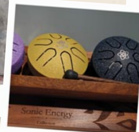
Für die Musiktherapie: Trommeln und Co.